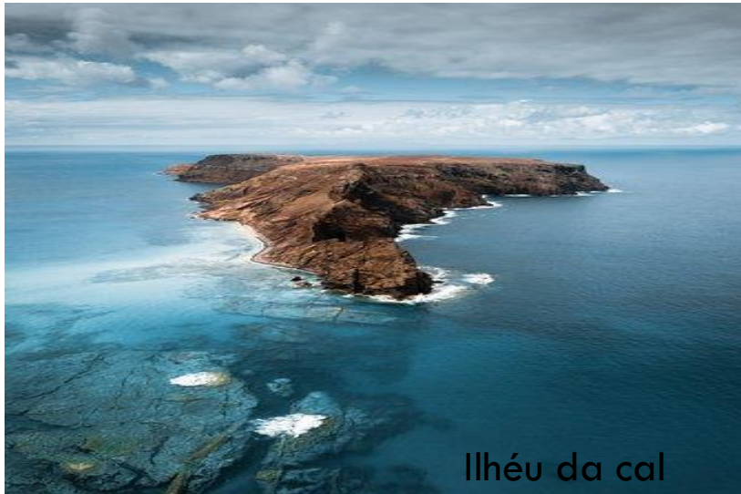
Ilhéu da cal