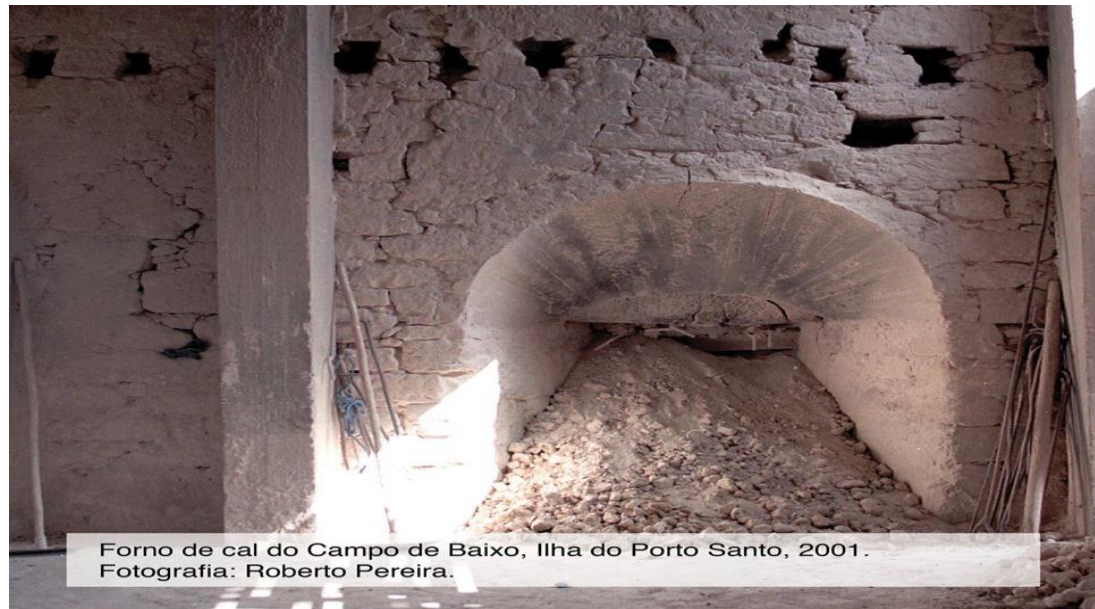
Forno de cal do Campo de Baixo, Ilha do Porto Santo, 2001.