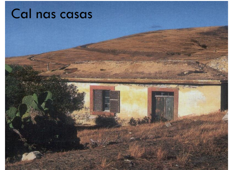
Cal nas casas